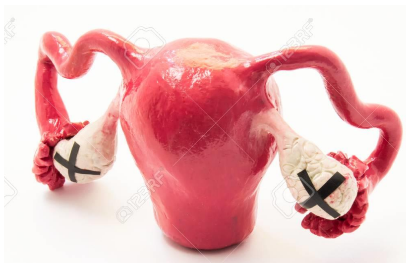
d. La ooforectomía (extirpación quirúrgica de los ovarios) produce menopausia y climaterio inducidos.